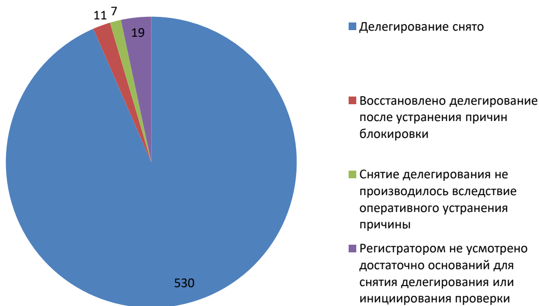
Рис.3 Итоги обработки обращений о снятии делегирования (сентябрь 2018)

За отчетный период по обращениям компетентных организаций были сняты с делегирования 541 доменное имя. Для 7 доменных имен снятие делегирования не потребовалось вследствие оперативного устранения причин блокировки администратором домена. В 19 случаях регистраторами не было усмотрено достаточно оснований для снятия делегирования или инициирования проверки администратора домена.